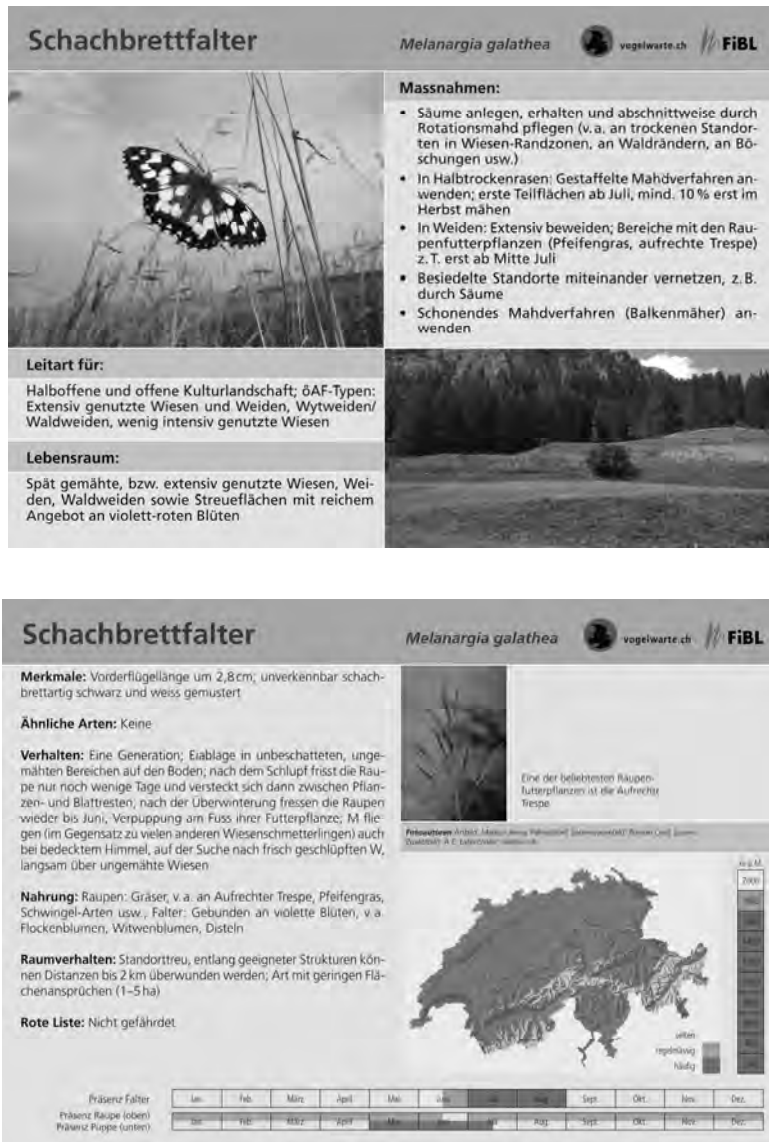
Abb. 3 Beispiel einer Leitartenkarte (Graustufenversion der Vorder- und Rückseite; Original farbig)

Für 2009 ist geplant, die Bewirtschafter von 30 Landwirtschaftsbetrieben mit Hilfe dieser Leitartenkarten zu beraten. Dabei werden pro Betrieb etwa ein halbes Duzend Leitarten eingesetzt. Bei dieser Beratung geht es um den gesamten Betrieb, nicht nur um einzelne ökologische Ausgleichsflächen. Gleichzeitig wird auch eine betriebswirtschaftliche Analyse mit Hilfe des Programms BETVOR durchgeführt. Ziel ist, dass jeder Betrieb eine merklich erhöhte Punktezahl erreicht.