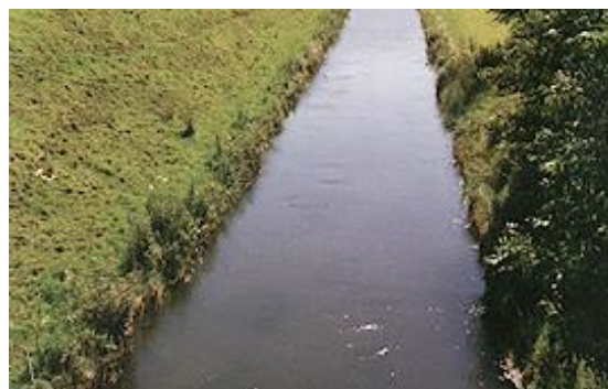
Klasse 3: stark beeinträchtigt; Gewässer ohne Wasserspiegelbreitenvariabilität, gewässerrfremder Uferbereich