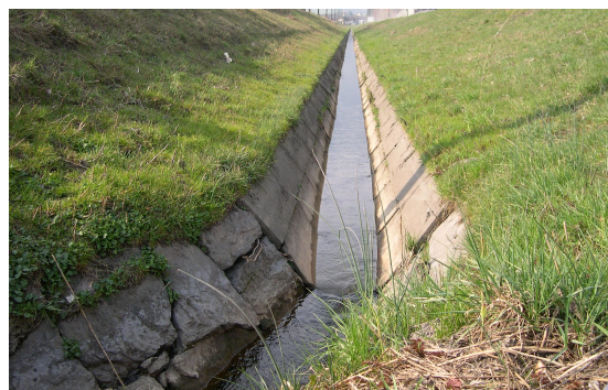
Klasse 4: naturfremd / künstlich; Gewässer mit vollständig verbauter, undurchlässiger Sohle (100%); Ufermauern