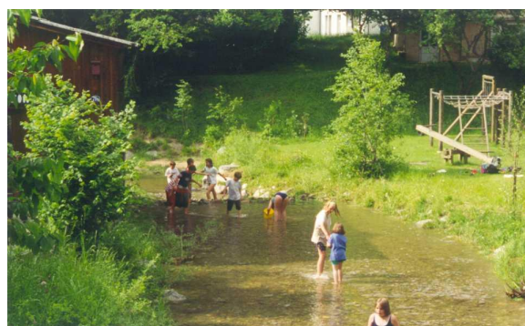
Gewässerabschnitt vor, während und nach der Revitalisierung